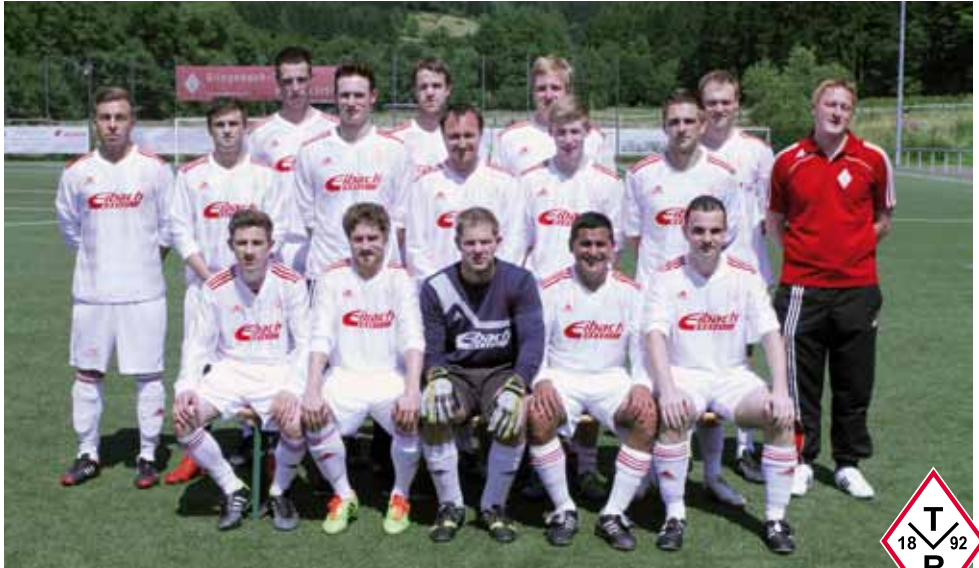
1. Mannschaft TV Rönkhausen