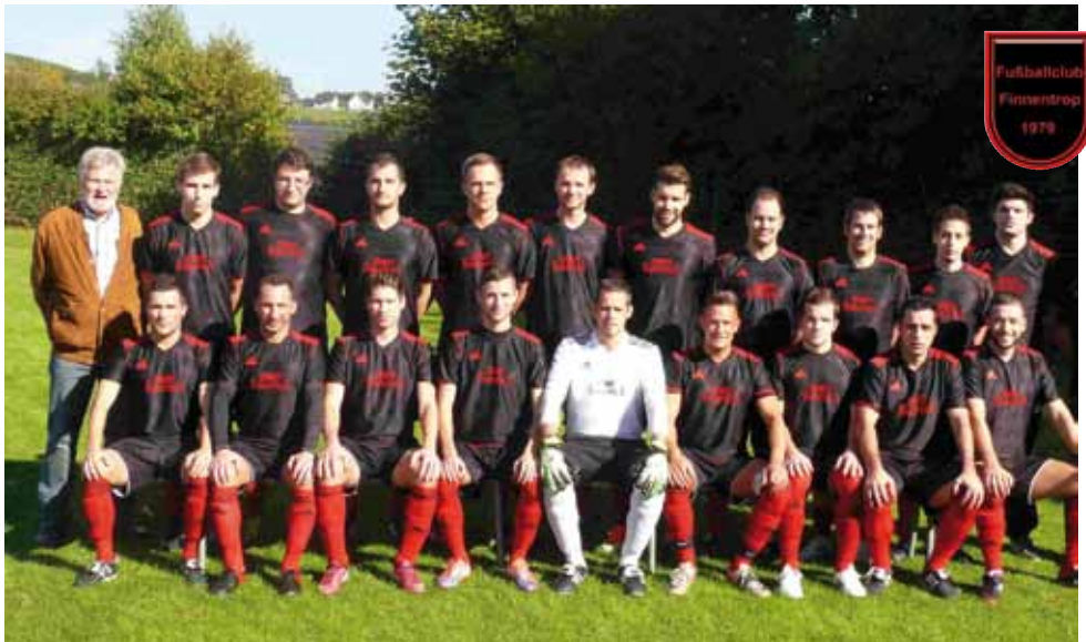
1. Mannschaft FC Finnentrop